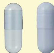
クチナシ青色素 透明 NT. A. BLUE TR